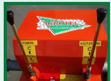
QUADRO COMANDI LEVEL BOARD CONSOLE KONSOLE