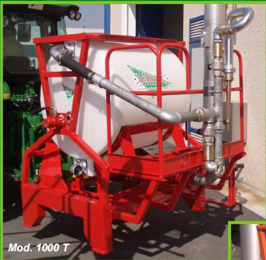
Mod. 1000 T