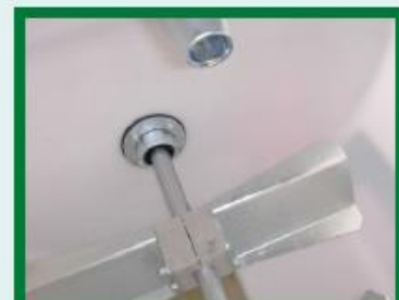
MISCELATORE AGITATOR MÉLANGEUR MISCHER

La gamme se compose de modèles sans agitateur interne «L» pour les travaux d'hydro-ensemencement légers et de modèles avec agitateur interne «LA» pour les travaux d'hydro-ensemencement importants, dotés d'une installation hydraulique supplémentaire. Le mélangeur de la série LA est monté sur des supports et des coussinets externes de façon à avoir une plus grande durée de vie des matériaux et la citerne en HDPE ne supporte aucune charge.