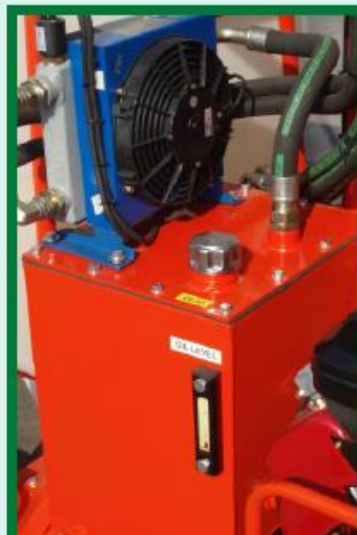
SCAMBIATORE DI CALORE HEAT EXCHANGE ÉCHANGEUR DE CHALEUR WÄRMEAUSTAUSCHER