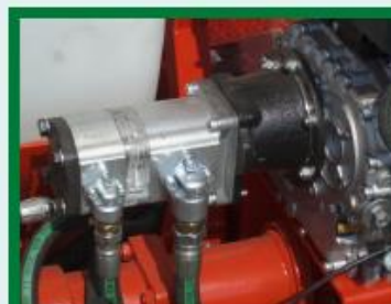
IMPIANTO IDRAULICO HYDRAULICS INSTALLATION HYDRAULIQUE HYDRAULIKANLAGE

Die Serie LT umfasst eine Serie von Nassausaatmaschinen von 500 bis 2000 Liter zur Anwendung am Heber des Traktors und wurde gedacht zur Benutzung in unwegsamem Gelände, wo daher die Notwendigkeit besteht kleine, leichte und robuste Nassausaatmaschinen aus Polyethylen HD zu verwenden. Alle Modelle sind ausgestattet mit einem internen Mischer mit doppelter Drehrichtung, der von der hydraulischen Anlage des Traktors betrieben wird, während die Volumenpumpe direkt von der Kraft des Traktors angetrieben wird.