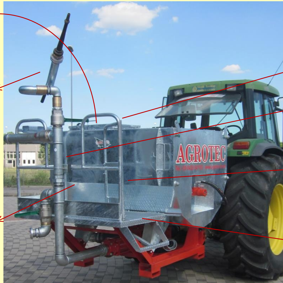
IDRO 2000 Tractor .

POSTAZIONE LAVORO PER OPERATORE CON PEDANA ANTISCIVOLO.